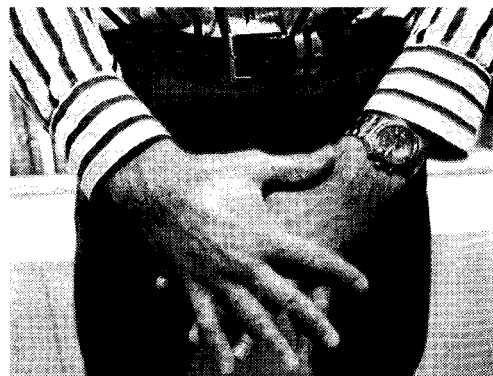
恥垢を溜めると ガンにつながるケースも……