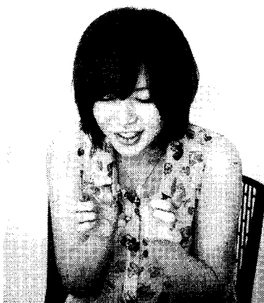
「皮が余っているとシゴきやすいの」