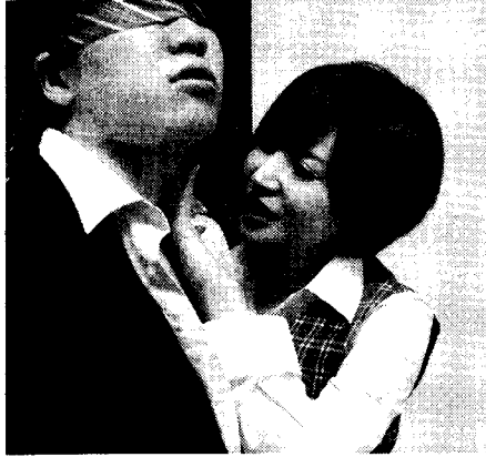
最新作「里美ゆりあにむりやり射撃させられた僕」(ムーティーズ)でも、包茎畑、出身のテクを披露

新潟県立がんセンターのホームページによれば、陰茎ガンは陰茎に発生する比較的まれなガンではあるが、老化に伴い60〜70代に多く認められ、患者の80%以上が包茎だったと伝えて