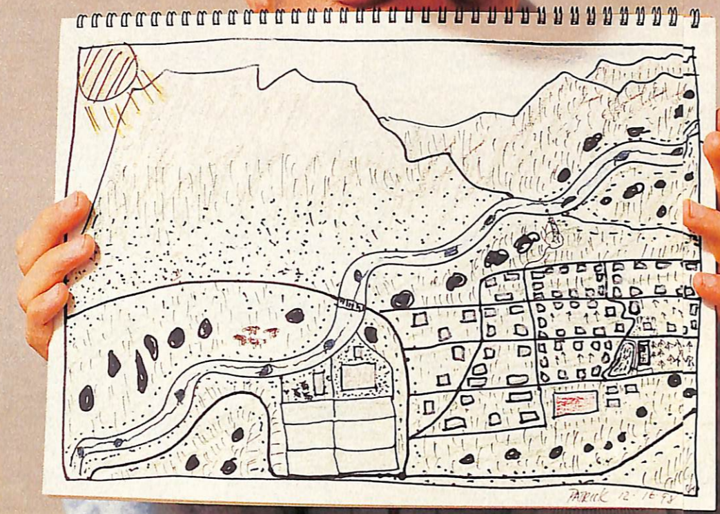
パトが描いた「芸術作品」。「走る新幹線から一瞬見える村で、環境のいい田舎なの。過疎化が進んでたけど、絵の外に工場団地ができて村が生き返ったんだ」

先生 また、ひっかかり傷のように見える木の描き方、無秩序に岩がゴロゴロし、川の中にも流れを妨げるような岩がありますね。ここからは、処理されないでいる心の傷つきがあるという印象を受けました。でも、母親との不仲や、友人からのイジメ体験があったことから、無理もないことだと思います。絵の右下は表面的、左上は内面的な部分が表示されやすいんですが、その境目を走る川に橋が架かっているの、「自分の内面と表面をつなげようとしている」のではないのでしょうか。 パト 絵からそんなことがわかるんだ。面白いね。 先生 まあ、1回テストしただけでは正確ではありませんが、とりあえず全体的な結論を言います。あなたは、10年前HIVに感染したのをきっかけに人生の目標設定をし、その実現に向けて頑張り、ある程度の成功を収めた。