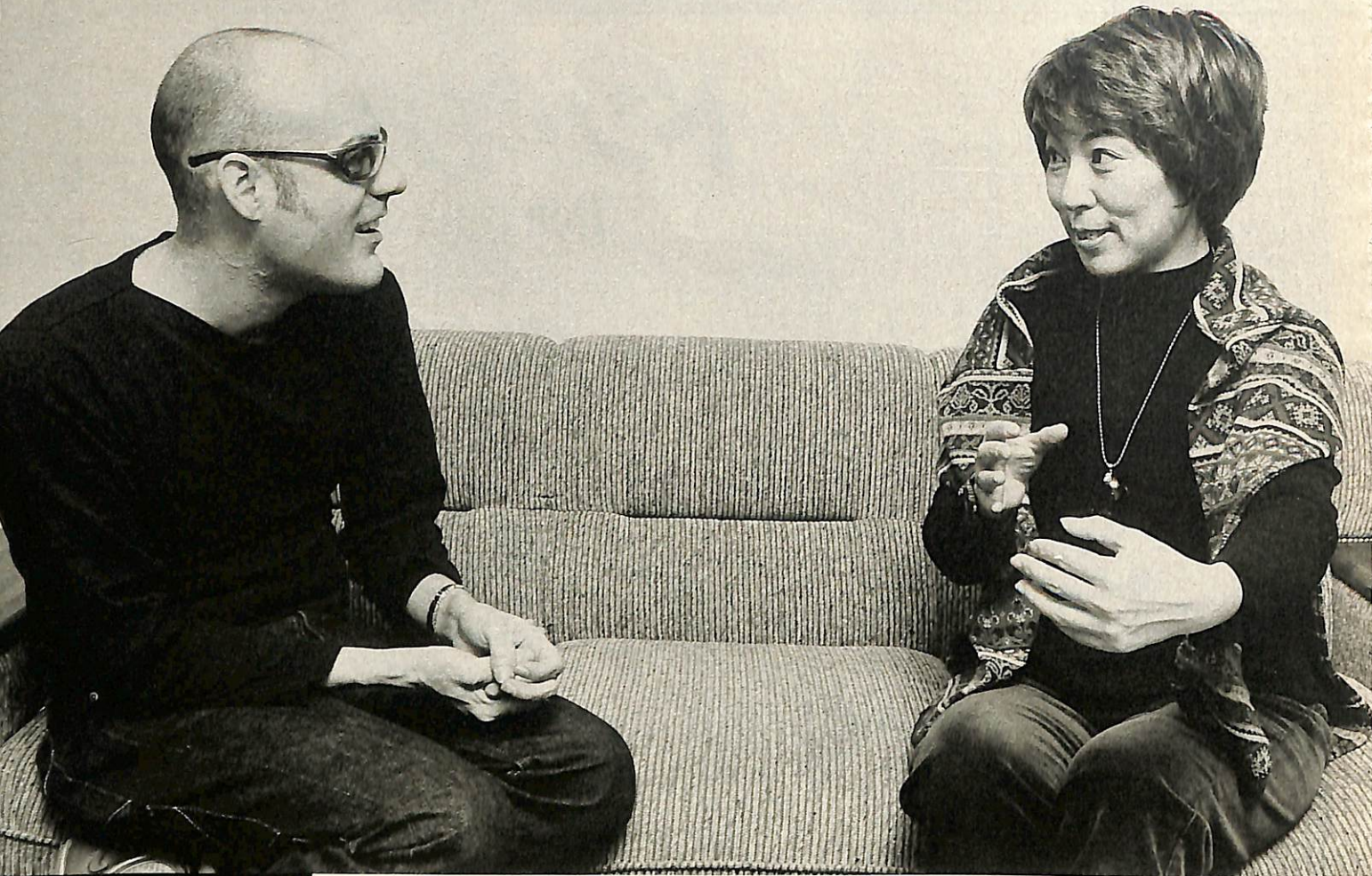
「陰陽師は、魔女的でもありアメリカインディアンのシャーマンに通じるような気もする」というパトに「インディアン文化はアジアから流れていったという説もありますからね」と祖笛さん